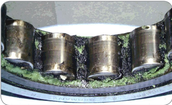
Chấtbôatrôn bị thoải hoá do phòg ñiề qua vòg bi